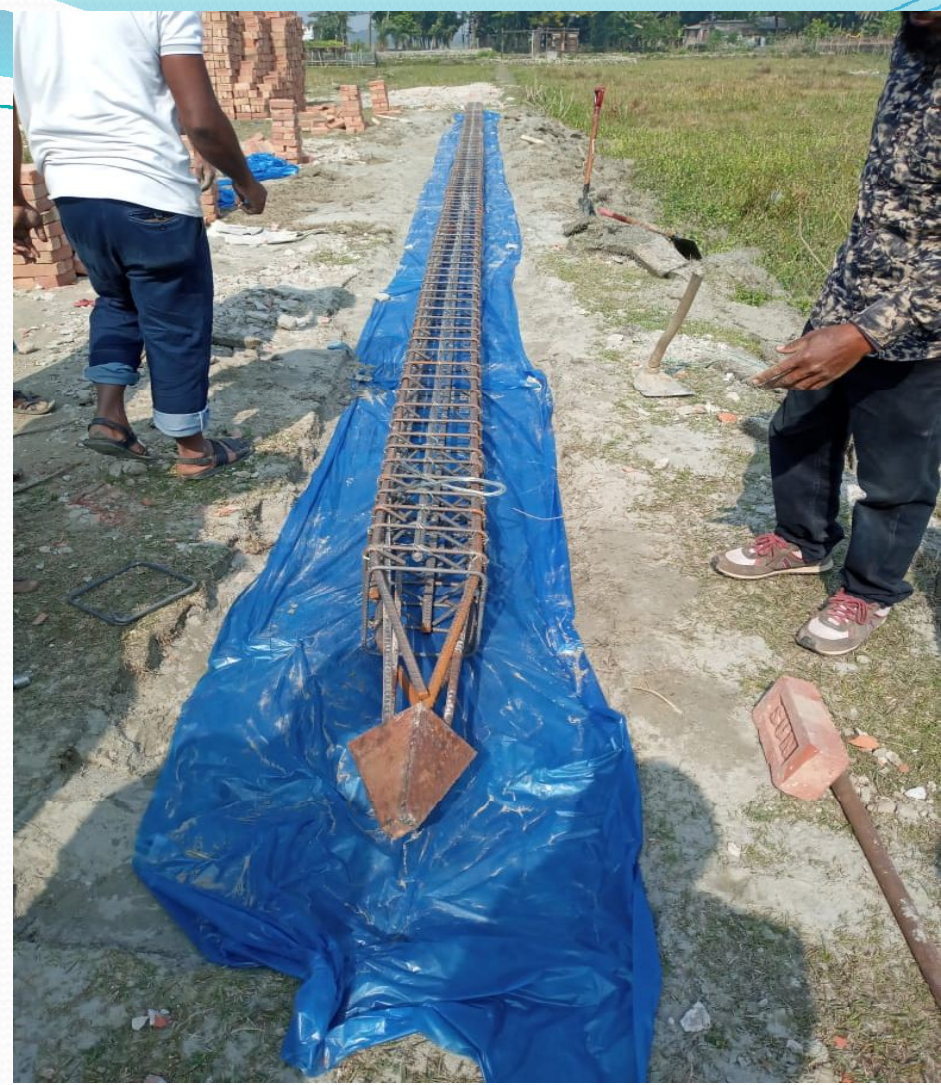
প্রকল্প পরিচালক ও গণপূর্ত বিভাগ, বরিশাল কর্তৃক প্রকল্পের অফিস ভবনের টেস্ট পাইলিং এর কাষ্টিং কাজ পরিদর্শন